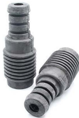
Exemplo da aparência dos foles de proteção com massa de parafina.

Tenha, por favor, em consideração que alguns foles dentro dos Kits de Proteção dos Amortecedores (VKDP) são feitos de borracha natural, que é um material bastante resistente utilizado para produzir peças de Equipamento Original. Neste tipo de borracha, adiciona-se no material uma massa de parafina para a proteção do ozono, portanto os foles de proteção podem ter uma aparência de “pó branco” que é completamente normal e não está relacionada à qualidade das peças. Esta aparência também é usual nas peças de suspensão de Primeiro Equipamento feitas com borracha natural.